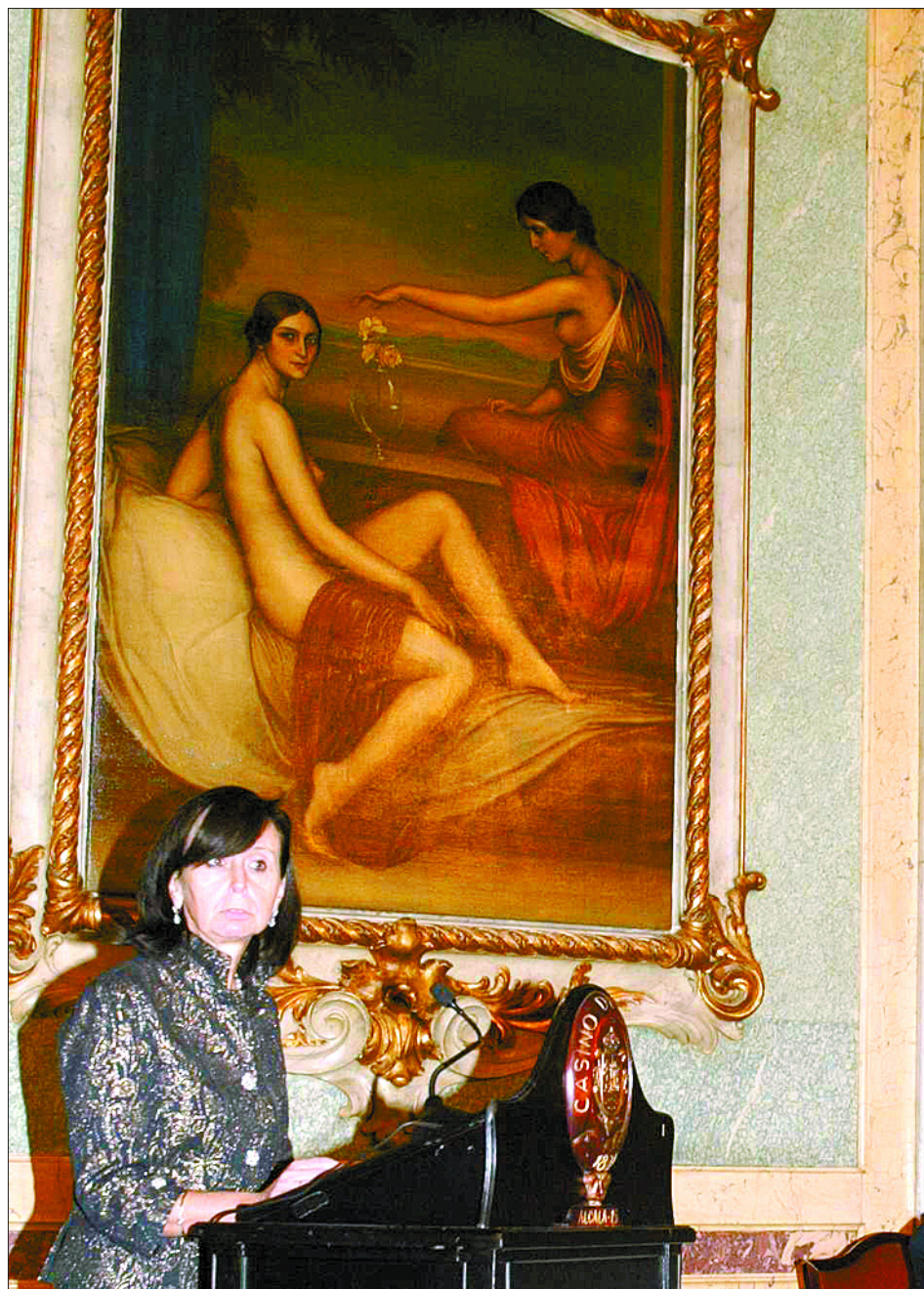
Sus peores enemigas. La presidenta del Tribunal Constitucional, María Emilia Casas, habla en un acto frente al cuadro Alegoría de la noche, de Romero de Torres.

Las mujeres tienen las mayores posibilidades de ser elegidas cuando el comité está compuesto por hombres de edad elevada, un 4,82% más. Según cálculos del estudio, si desde 1987 se hubiera inclui-